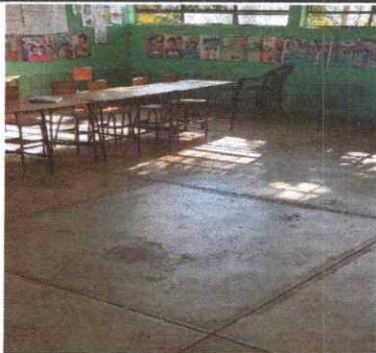
Foto 3: En la imagen se visualiza el piso de torta de cemento que sera sustituida con piso ceramico.