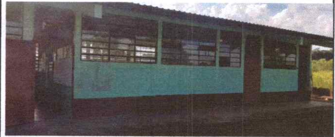
Foto 2: Se logra visualizar los vidrios que se van a completar en las ventanas del establecimiento.