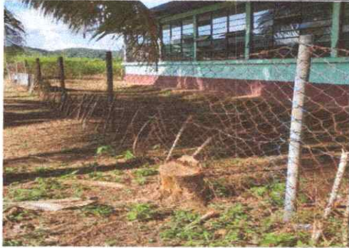
Foto1: En la imagen se aprecia el deterioro de la malla que complementa la circulación del predio del edificio escolar.