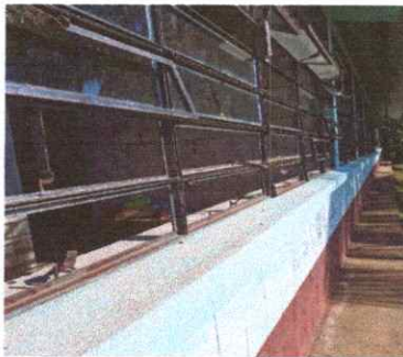
Foto 5: Se evidencia el deterioro de las ventanas en mal estado que necesita mejoramiento.